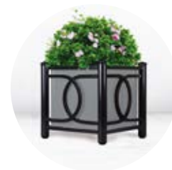
Jardinière LE NÔTRE p. 53