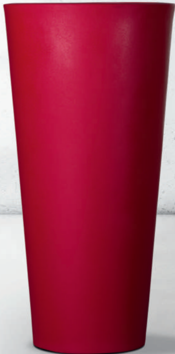
RAL Rouge R701