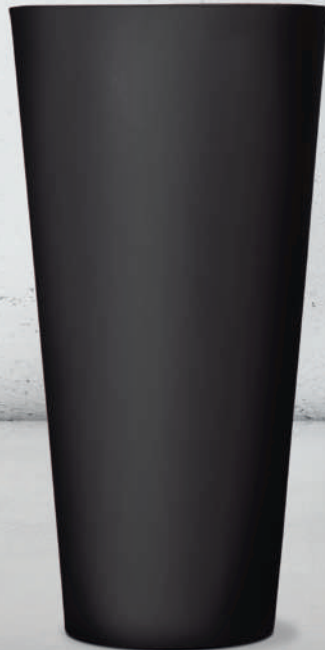
RAL Prune R320