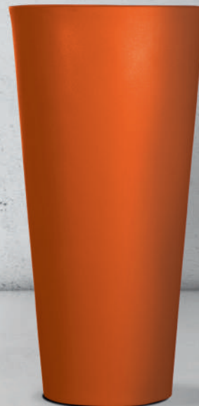
RAL Orange OR422